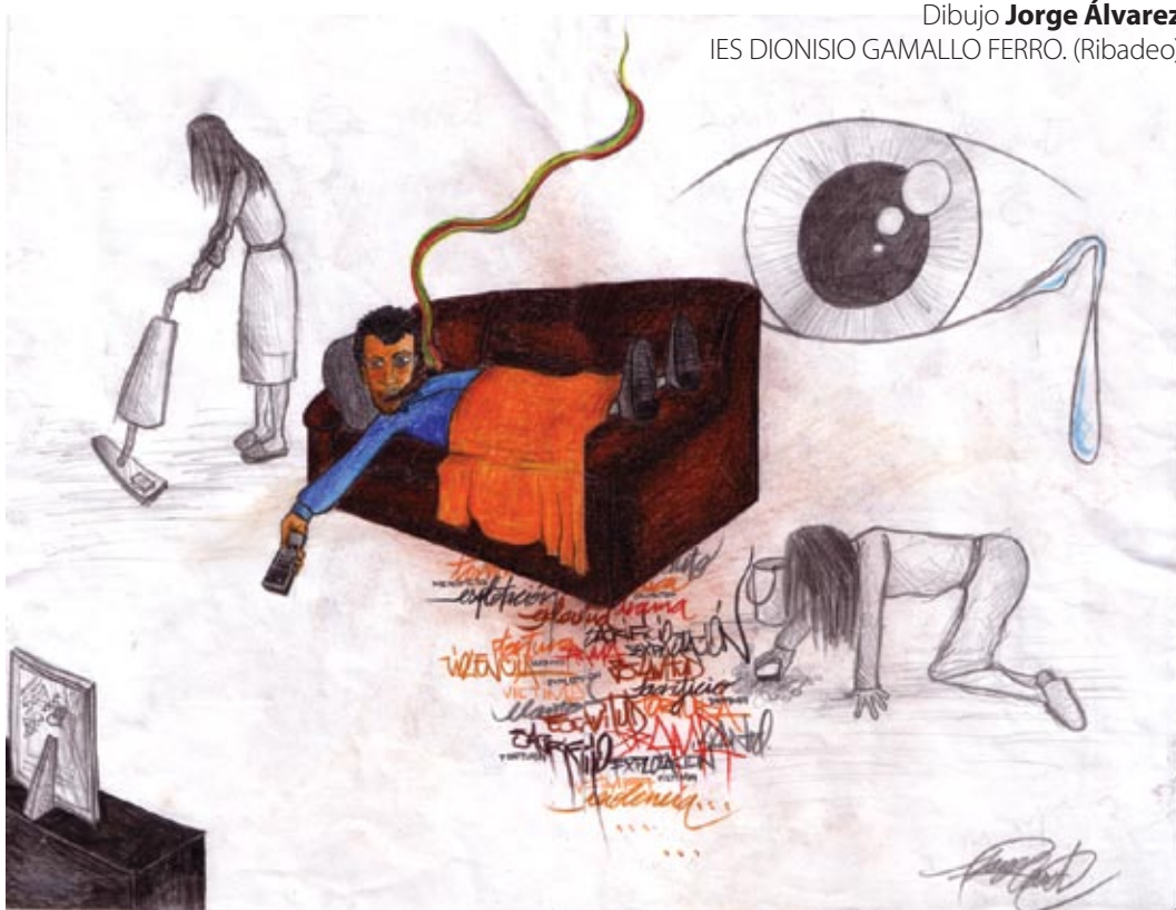
Dibujo Jorge Álvarez IES DIONISIO GAMALLO FERRO. (Ribadeo)